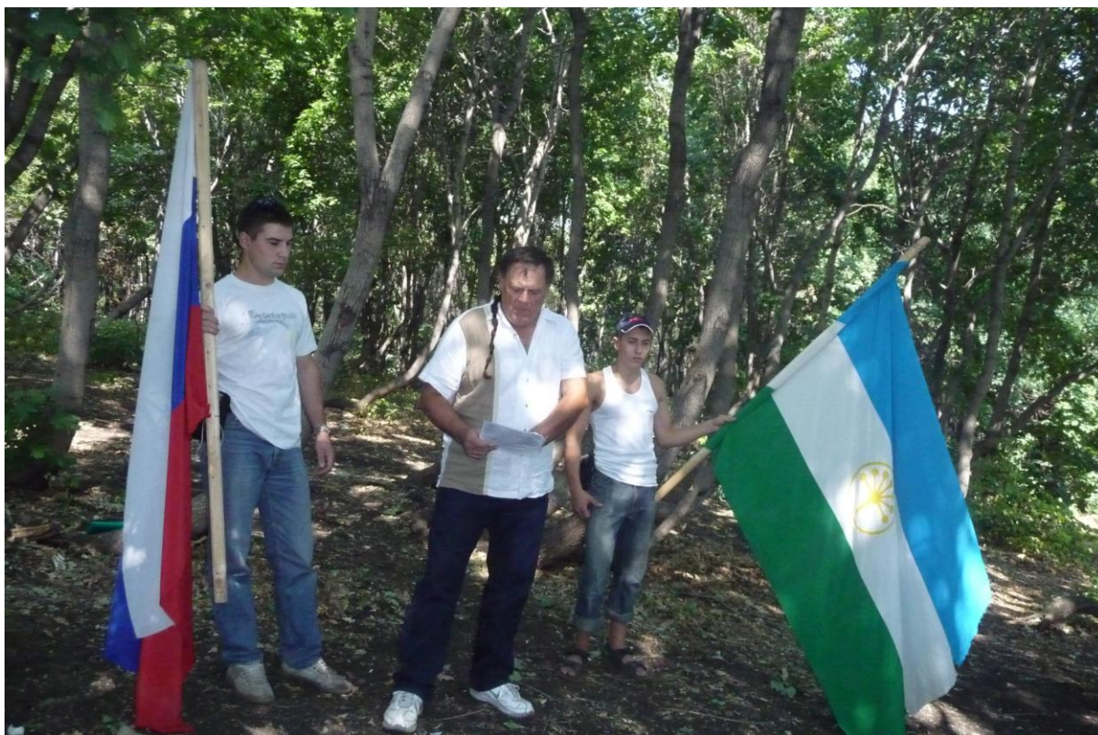
Рис. 1. Профессор Университета Северного Техаса Джонатан Байрон Хук у подножия священной горы башкир Тора-тау 14 августа 2010 г. оглашает на английском языке текст Декларации от 1 мая 2010 г. «Оставьте нам будущее»